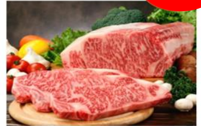
佐賀牛詰め合わせ